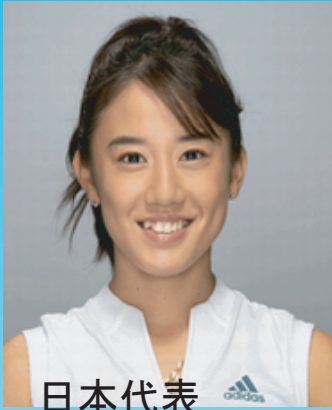
日本代表 加藤未唯プロ