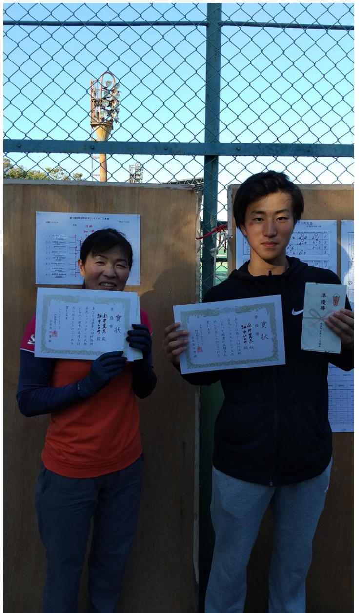
(阿倍野区民ミックス大会 優勝)