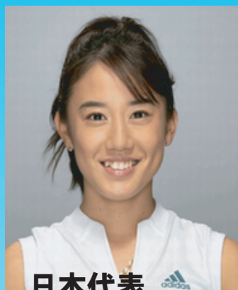
日本代表 加藤未唯プロ